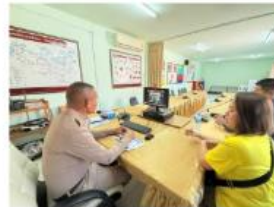
การรับการอบรมคดีเกี่ยวกับเด็กและเยาวชน