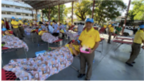
บริจาคโลหิตเนื่องในวันเฉลิมพระชนมพรรษาสมเด็จพระชนกาธิบดีศรีมหาภูมิพลอดุลยเดชมหาราช