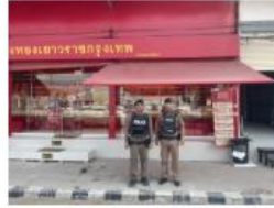
จังหวัด 20 พร้อม 2.30 2.4 ออกตรวจจุดเสี่ยง จุดต่อ แหลม ในเขตพื้นที่รับผิดชอบ