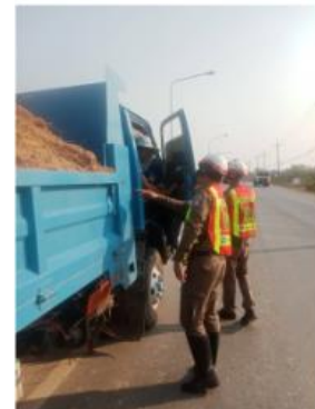
การจับกุมรถบรรทุกกระทำผิดกฎหมาย