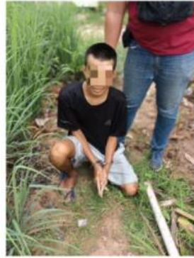
การจับกุมผู้ต้องหาเกี่ยวกับยาเสพติด