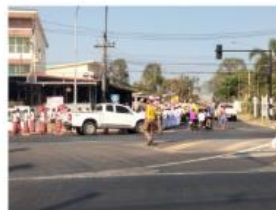
อำนวยความสะดวกให้แก่ชาวบ้าน