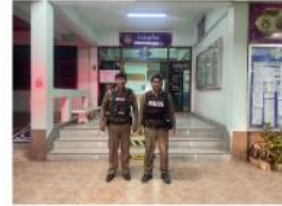
การออกตรวจพื้นที่เสี่ยง จุดต่อแหลม การดำเนินการ ตามโครงการ Police 4.0