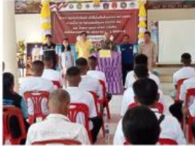
การดำเนินการโครงการร้อยเอ็ดโมเดล