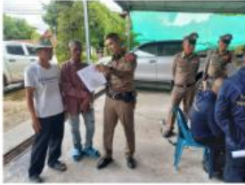
สภ.จ้งหาร จับกุมผู้กระทำความผิดกฎหมายยาเสพติด