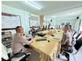
การอบรมเจ้าหน้าที่งานสอบสวนการดำเนินการ รายงานเหตุสำคัญ