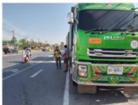
การดำเนินการกับรถบรรทุกที่ทำผิดกฎหมาย