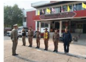
การปล่อยแถวเวรบูรณาการประจำเดือน ธันวาคม 2567